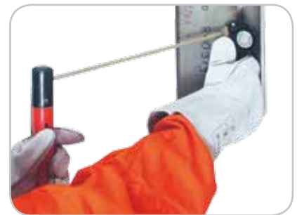
Aby użyć bezprzewodowego zdalnego sterowania R11-T, wystarczy dotknąć elektrody