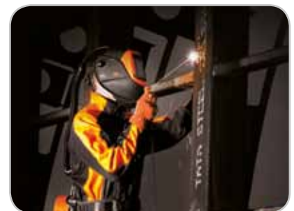
Spawanie w trudnych warunkach na placach budowy i w terenie

Więcej informacji na naszej stronie: www.kemppi.com/wps