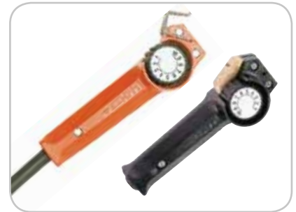
R10 i R11-T

Możliwość użycia jednego z dwóch typów zdalnego sterowania zapewnia wygodę użytkowania i minimalizację kosztów prac spawalniczych. Zdalne sterowanie R10 umożliwia regulację parametrów spawania w miejscu wykonywania pracy. Bezprzewodowy moduł R11-T zapewnia większą swobodę przemieszczania się.