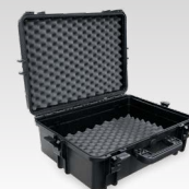
Walizka na plac budowy IP67 060432