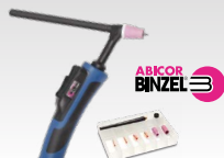
SR26DB - 4 m 038271