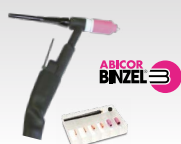
SR26L - 8 m 046184